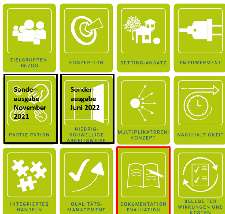
Abbildung 11: 12 Kriterien für gute Praxis

Die Evaluation kann entweder im Laufe des Projekts (Prozessevaluation) und/oder am Projektende (Ergebnisevaluation) erfolgen. In der Dokumentation werden Inhalte und Ergebnisse von Arbeitsprozessen abgebildet, um die Konzeption und Umsetzung von Maßnahmen auch für Außenstehende nachvollziehbar und überprüfbar festzuhalten.