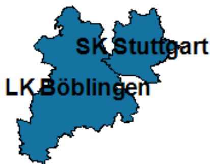
Abbildung 3: Stadtkreis Stuttgart und Landkreis Böblingen

In Kapitel 2 sind die Highlights des letzten Jahres aus der Region Stuttgart-Böblingen zu finden. Die Beiträge hierfür wurden von den Projektverantwortlichen der jeweiligen Jobcenter verfasst.