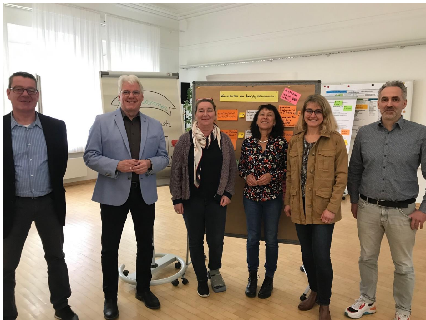
Abbildung 1: teamw()rk für Gesundheit und Arbeit, (Foto: vdek)

vdek-Federführer traf sich am 23. Februar 2023 in der Bundesagentur für Arbeit, Regionaldirektion Baden-Württemberg