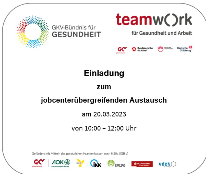
Abbildung 10: Einladung zum jobcenterübergreifenden Austausch am 20.03.2023

Der erste Austausch findet in digitaler Form am 20.03.2023 statt. Hierzu sind alle Jobcenter unter vdek-Federführung herzlich eingeladen. Der zweite Austausch in diesem Jahr ist ebenfalls bereits in Planung und soll im September in Stuttgart stattfinden.