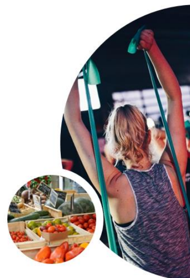
Abbildung 9: Übersichtsflyer Jobcenter Landkreis Ravensburg

Herausgeber: GKV-Spitzenverband · www.gkv-spitzenverband.de