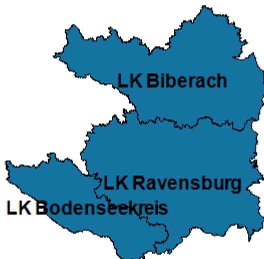
Abbildung 5: Region Bodensee-Oberschwaben