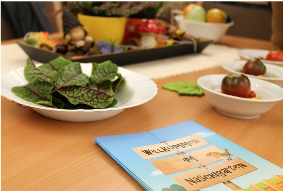
Foto: Gedeckter Tisch im Stadtteilgarten der AWO Altenburg